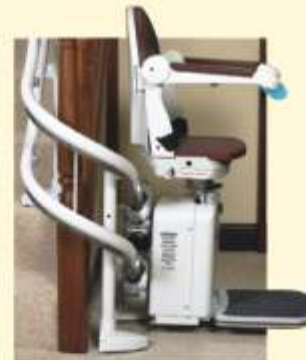
Salva spazio slim